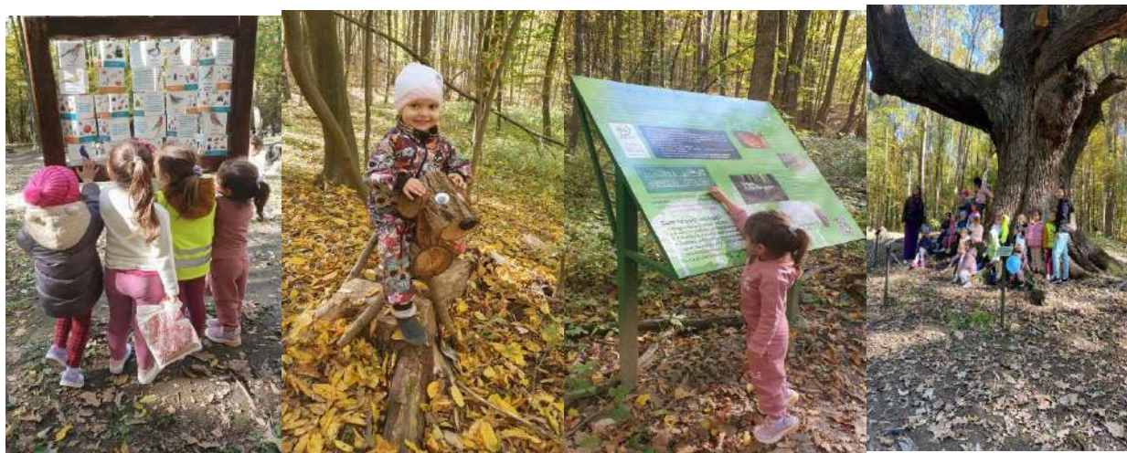
1. Stejarul de 1000 de ani – Gheboieni, Dâmbovița

Educația pentru sănătate la preșcolari implică dezvoltarea fizică, emoțională și socială prin experiențe directe. În cadrul „Săptămânii Verzi”, am organizat două activități care au promovat mișcarea în aer liber, contactul cu natura și cooperarea între copii: vizita la Stejarul de 1000 de ani din Gheboieni, Dâmbovița și excursia la parc de aventură „Magic Woodland” din Târgoviște.